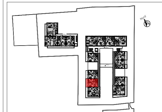
APPARTEMENT C203 - T2 2ème étage

Résidence Séniors 1-5 rue Albert Lépée Saint-Pierre-en-Auge